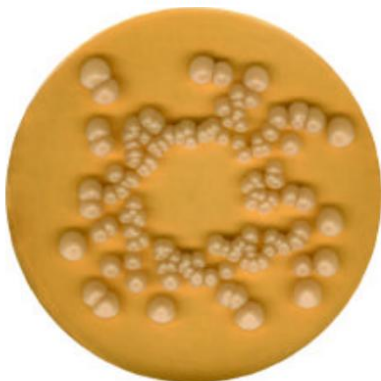
Saccharomyces cerevisiae ATCC9080

Control de Esterilidad: No hubo desarrollo hasta las 48 horas de incubación.