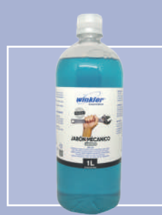
JABÓN MECANICO LÍQUIDO WK-116 2-15-049 - 1L Rapa Rosca 2-15-050 - 1L Tapa Push Pull 2-15-110 - 5L