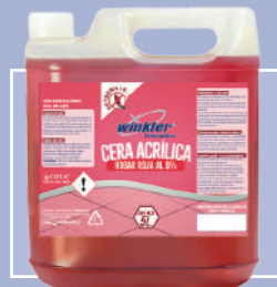
CERA ACRILICA AUTOBRILLO 9% Hogar Roja WK-630R 2-35-060 - 500ml 2-35-063 - 1L 2-35-064 - 5L