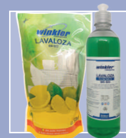
LAVALOZA ECONÓMICO WK-023 2-35-890 - 500ml - Doypack 2-35-891 - 500ml - Tapa Push Pull 2-35-892 - 1L - Tapa Push Pull