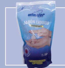
JABON HIGIENIZANTE WK-119 2-35-504 - 500ml - Doypack 2-35-505 - 500ml - Tapa Push Pull 2-35-505 - 500ml - Tapa Dosificadora