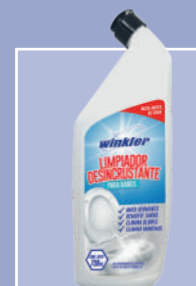
LIMPIADOR DESINFECTANTE DESINCRUSTANTE Hogar WK-108 2-35-934 - 750g - Tapa Flip Top