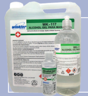
GEL ALCOHOL Incoloro WK-117 2-35-381 - 1L Sachet 2-35-382 - 100ml Tapa Flip Top 2-35-384 - 1L Tapa Flip Top 2-35-385 - 340ml Tapa Dosificadora 2-35-389 - 1L Tapa Dosificadora 2-10-071 - 5L