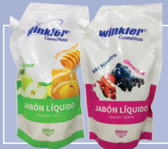
JABON LIQUIDO Doypack 900ml WK-120 2-35-515 - Manzana Miel 2-35-525 - Yoghurt Berries