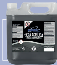
CERA ACRILICA AUTOBRILLO 9% Hogar Negra WK-630N 2-35-067 - 1L 2-35-068 - 5L