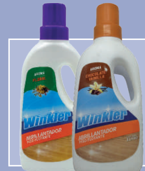
ABRILLANTADOR PISO FLOTANTE HOGAR 2-35-000 - 1L - Floral 2-35-002 - 1L - Choco/Vainilla 2-35-003 - 1L - Lavanda