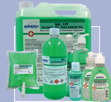
GEL ALCOHOL WK-117 2-35-391 - 250ml Tapa Flip Top 2-35-392 - 340ml Tapa Flip Top 2-35-393 - 340ml Tapa Dosificadora 2-35-394 - 500ml Tapa Dosificadora 2-35-395 - 100ml Tapa Flip Top 2-35-396 - 250ml Tapa Flip Top 2-35-397 - 500ml Tapa Flip Top 2-35-398 - 1L Tapa Flip Top 2-35-399 - 1L Tapa Dosificadora 2-35-402 - 800ml Sachet con Válvula 2-35-404 - 1L Sachet con Válvula 2-10-030 - 5L