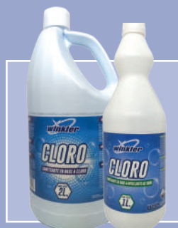
CLORO AL 5% Hogar WK-CL5 2-35-075 - 1L 2-35-076 - 2L