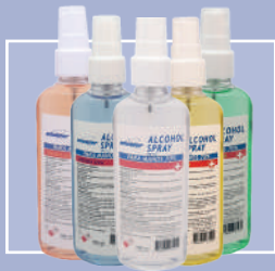
ALCOHOL SPRAY PARA MANOS 70% WK-113 Aromas 100ml 2-35-020 - Incoloro 2-35-021 - Limón 2-35-022 - Manzana 2-35-023 - Naranja 2-35-024 - Uva