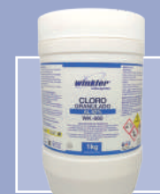
CLORO GRANULADO 62% WK-860 2-02-105 - 1kg