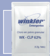
CLORO GRANULADO 62% Sachet WK-CLP 2-02-093 - 4,5g