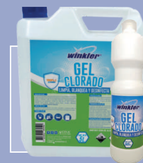
CLORO GEL AL 3% Hogar WK-645H 2-35-090 - 900ml 2-35-093 - 5L