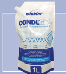
GEL CONDUCTOR ULTRASONIDO Recarga 2-35-410 - 1L