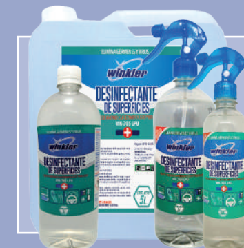
DESINFECTANTE AC 0.3% WK-705Lpu 2-35-250 - 500ml 2-35-251 - 500ml con Gatillo 2-35-252 - 1L Tapa Rosca 2-35-253 - 1L con Gatillo 2-35-254 - 5L