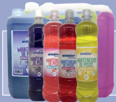
MANTENEDOR DE PISO Hogar WK-635 Lpu 2-36-000 - 900ml - Lavanda 2-36-001 - 1,8L - Lavanda 2-36-002 - 5L - Lavanda 2-36-003 - 900ml - Floral 2-36-004 - 5L - Floral 2-36-006 - 900ml - Citrus 2-36-008 - 5L - Citrus 2-36-010 - 900ml - Primavera 2-36-012 - 5L - Primavera