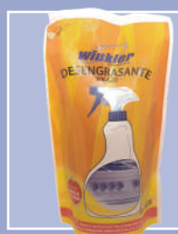
DESENGRASANTE Hogar WK-020LPU 2-35-200 - 500ml Doypack 2-35-201 - 1L 2-35-202 - 500ml