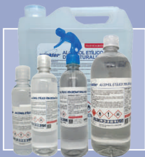
ALCOHOL ETILICO DESNATURALIZADO 70% 2-35-046 - 250ml Tapa Flip top 2-35-047 - 500ml Tapa Flip top 2-35-051 - 500ml con Gatillo 2-35-048 - 1L Tapa Rosca 2-35-052 - 1L Tapa con Gatillo 2-35-049 - 5L