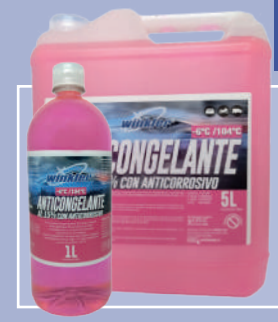
ANTICONGELANTE AL 15% WK-145 2-35-055 - 1L Rapa Rosca 2-35-056 - 5L