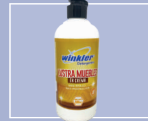
LUSTRA MUEBLES EN CREMA WK-580 Lpu 2-35-975 - 500ml - Tapa Flip Top