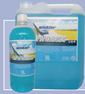
LIMPIAPARABRISAS WK-576 2-17-535 - 1L Rapa Rosca 2-17-537 - 5L