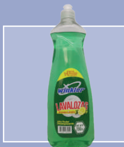
LAVALOZA CONCENTRADO 2-35-900 - 300ml - Tapa Push Pull 2-35-905 - 500ml - Tapa Push Pull 2-35-910 - 750ml - Tapa Push Pull