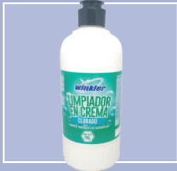
LIMPIADOR EN CREMA CLORADO WK-540D 2-35-930 - 750g - Tapa Flip Top