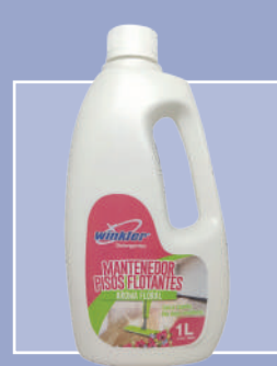
MANTENEDOR PISO FLOTANTE Hogar WK-650 2-36-500 - 1L - Floral 2-36-502 - 1L - Chocolate/Vainilla 2-36-503 - 1L - Lavanda