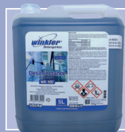
DESINFECTANTE DETERGENTE WK-100 2-03-400 - 1L - Tapa Rosca 2-03-401 - 5L