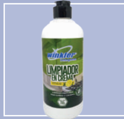
LIMPIADOR EN CREMA CITRUS WK-540 2-35-932 - 750g - Tapa Flip Top