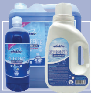
DETERGENTE LIQUIDO PARA ROPA Enzimatico WK-315E 2-35-310 - 1L 2-35-312 - 3L 2-35-313 - 5L