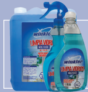
LIMPIAVIDRIO USO DIRECTO WK-575 Lpu 2-35-950 - 500ml - Recarga 2-35-951 - 1L - Recarga 2-35-953 - 500ml - con Gatillo 2-35-954 - 5L