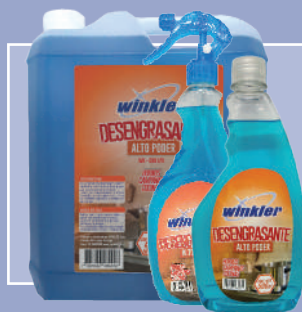
DESENGRASANTE ALTO PODER WK-090 LPU 2-35-205 - 500ml 2-35-210 - 500ml Recarga 2-35-215 - 5L