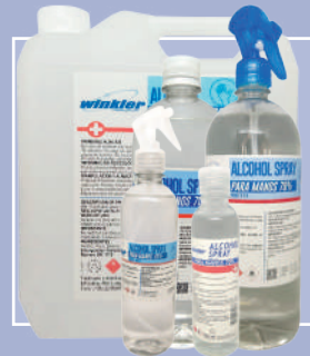
ALCOHOL PARA MANOS 70% WK-113 Incoloro 2-35-030 - 500ml con Gatillo 2-35-032 - 250ml Tapa Flip top 2-35-035 - 1L Tapa Rosca 2-35-036 - 1L con Gatillo 2-35-037 - 5L