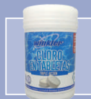
CLORO EN TABLETAS Triple Acción WK-855 2-01-102 - 1kg