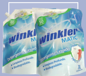
DETERGENTE LIQUIDO PARA ROPA WK-315 2-35-308 - 3L CON CORNER 2-36-309 - 3L SIN CORNER