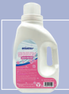
SUAVIZANTE PARA ROPA WK-SOFT 2-36-701 - 3L 2-36-703 - 5L