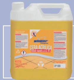
CERA ACRILICA AUTOBRILLO 9% Hogar Amarilla WK-630A 2-35-065 - 1L 2-35-066 - 5L