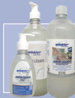
JABON PERLADO CREMA WK-120 CR 2-35-480 - 250ml Tapa Flip Top 2-35-485 - 340ml Tapa Dosificadora 2-35-489 - 500ml Tapa Dosificadora 2-35-491 - 1L Tapa Dosificadora