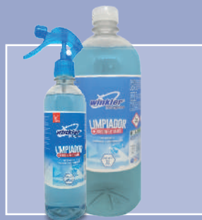
LIMPIADOR DESINFECTANTE WK-100 Lpu 2-35-955 - 500ml - con Gatillo 2-35-956 - 1L - Tapa Rosca