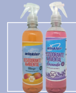
DESODORANTE AMBIENTAL Aromas 2-35-270 - 500ml - Lavanda 2-35-271 - 500ml - Mango