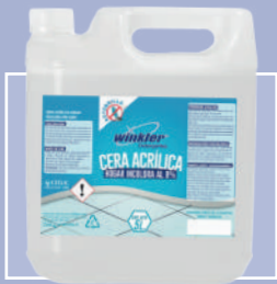
CERA ACRILICA AUTOBRILLO 9% Hogar Incolora WK-630I 2-35-059 - 500ml 2-35-061 - 1L 2-35-062 - 5L