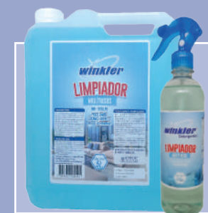
LIMPIADOR MULTIUSO WK-550 Lpu 2-35-957 500ml - con Gatillo 2-35-958 - 5L