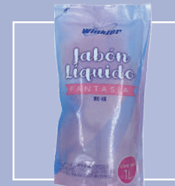
JABON LIQUIDO Fantasia WK-115 Doypack WK-115 2-35-500 - 1L - Fantasia 2-35-501 - 1L - Lavanda