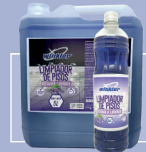
LIMPIADOR DE PISOS WK-634 Lpu 2-35-920 - 900ml - Lavanda 2-35-922 - 5L -