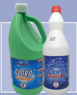
CLORO AL 3% Hogar WK-CL3 2-35-067 - 1L 2-35-068 - 2L