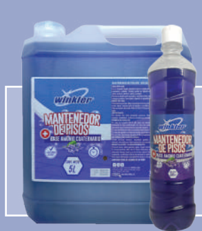
MANTENEDOR DE PISO DESINFECTANTE Hogar WK-635QD 2-36-100 - 900ml - Lavanda 2-36-102 - 5L