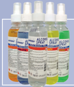
ALCOHOL SPRAY PARA MANOS 70% WK-113 Aromas 250ml 2-35-025 - Incoloro 2-35-026 - Limón 2-35-027 - Manzana 2-35-028 - Naranja 2-35-029 - Uva